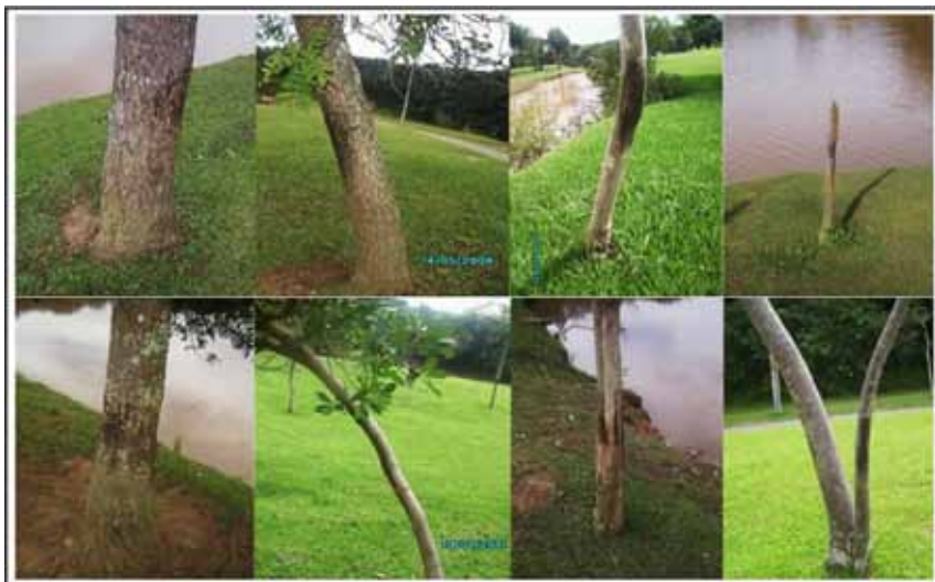
Figura 1. Manchas escuras deixadas em árvores por capivaras no Parque Tingui.

Foram registradas manchas escuras encontradas em troncos de árvores com altura máxima de 70 centímetros do solo (Figura 1). Estas manchas tam-