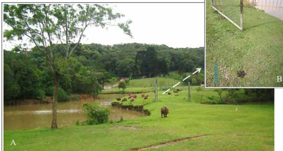
Figura 4. Registro de marcação observado em ritual de rivalidade entre machos: (A) momento em que um dos machos se afasta para marcar o limite do território; (B) detalhe de marcação (mancha escura e fezes) deixada pelo macho.

que com os pelos eriçados se aproximaram, bateram os dentes e vocalizaram. Em seguida se afastaram e um deles esfregou a glândula supranasal em tronco de árvore e defecou na base. O macho rival apresentou mesmo comportamento, porém a secreção da glândula e as fezes foram depositadas em estrutura metálica (Figura 4). Após este ritual de marcação cada macho retornou a sua área de origem onde permaneceram junto ao grupo. De acordo com Schaller e Crawshaw (1981), quando um macho intruso é perseguido, ambos apresentam comportamento de marcação, conferindo imunidade temporária ao ataque. Confirmando que o ritual observado está