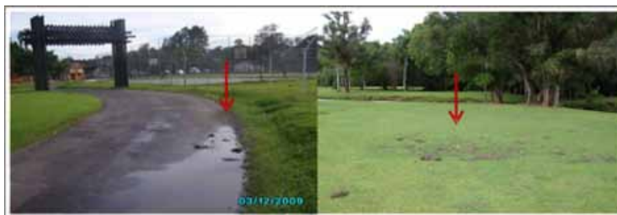
Figura 6. Latrinas observadas no Parque Tingui, Curitiba-PR.

mulo de grandes quantidades de fezes em alguns locais do parque (Figura 6). Vários mamíferos apresentam comportamento semelhante de fazer latrina no limite de seus territórios (EISENBERG; REDFORD, 1999). Segundo Cabrera (1960), é a maneira que cada grupo familiar utiliza para conservar a área de uso. No Parque Tingui este acúmulo de excrementos pode indicar delimitação de território pela população de capivaras que ocorre na área.