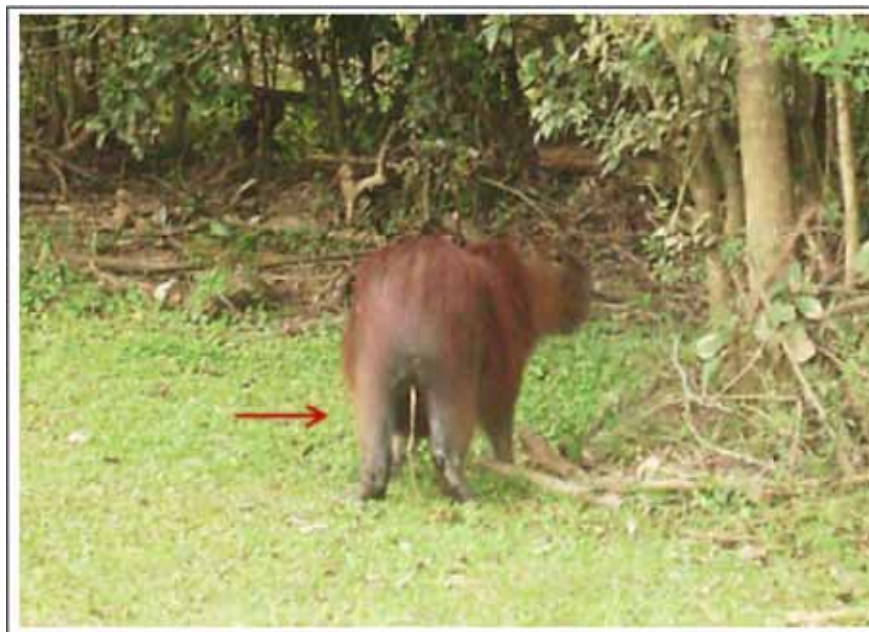
Figura 3. Capivara esfregando glândula perianal em galho de borda de mata ciliar.

marcação de território com glândula perianal e urina.