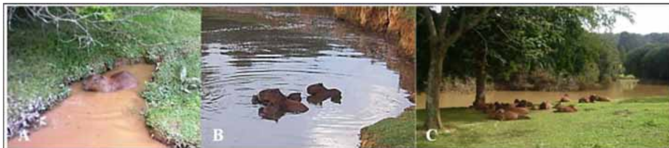
Figura 7. Registro de capivaras em momentos de maior incidência de sol: (A) em piscina de lama; (B) no lago; (C) na sombra.

capivaras apresentam poucos pelos e poucas glândulas sudoríparas, além destas serem pouco desenvolvidas (PEREIRA; JENKINSON; FINLEY, 1980). Talvez, para compensar esta deficiência, os animais necessitem de fatores externos para manter o equilíbrio térmico e por isto utilizam ambientes de menor temperatura (sombra e água) nos períodos mais quentes.