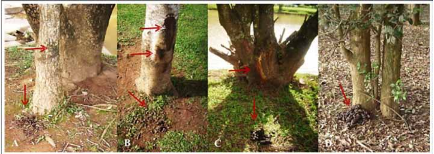
Figura 5. Registros encontrados em árvores: (A) mancha escura e fezes; (B) retirada de lasca, mancha escura e fezes; (C) retirada de lasca e fezes; (D) fezes.

da mancha e fezes foi observado também marcas de retirada de lascas de casca do tronco (Figura 5B), marcas de retirada de lascas e fezes (Figura 5C) e em algumas, montículo de fezes na base da árvore (Figura 5D).