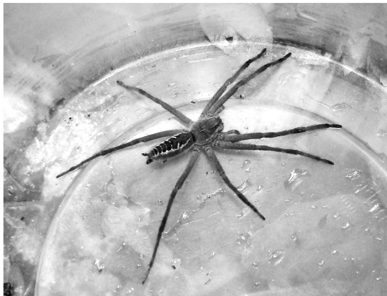
Figura 5 - Aglaoctenus spp.