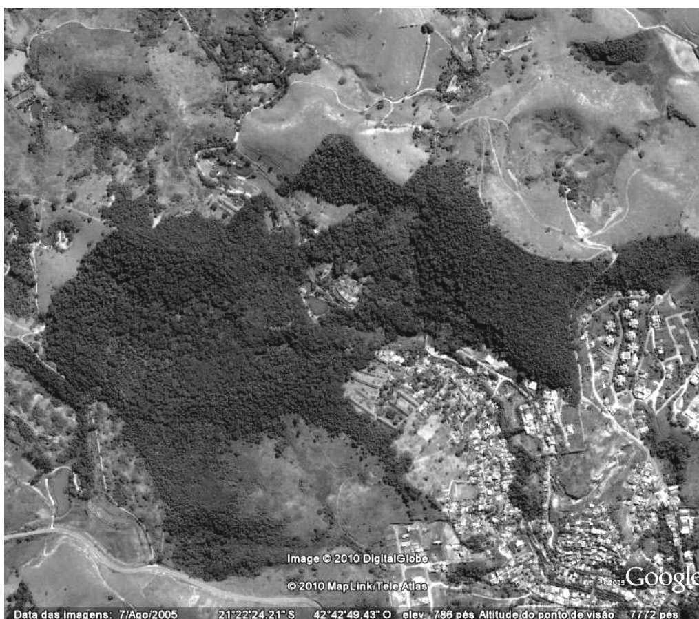
Figura 1 - Estação Ecológica Água Limpa, Cataguases, MG.

A Estação Ecológica Água Limpa se localiza ao leste da Zona da Mata de Minas Gerais, no município de Cataguases (21° 22' 26" S e 42° 42' 53" W) (Figura 1), com uma área total de 70,66 ha. O clima da região varia do tipo Cwa, tropical úmido a Aw, semi-úmido de verões quentes (Köppen). A Unidade de Conservação foi criada em 27 de setembro de 1994 através do decreto n° 36.072, sendo enquadrada na categoria de Estação Ecológica, deixando de ser Parque Estadual Florestal.