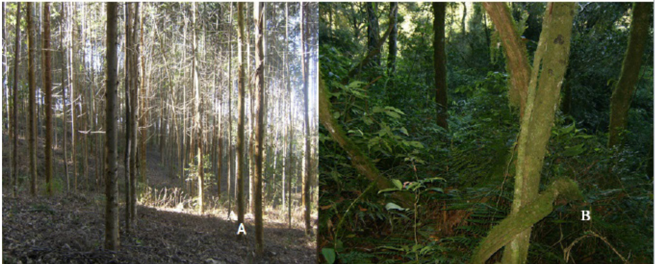
Figura 1. Áreas de estudo: cultura de E. grandis (A) e fragmento de Mata Atlântica (B) no sul do Brasil. Figure 1. Study sites: E. grandis plantation (A) and the Atlantic forest fragment (B) in Southern Brazil.

A segunda área compreende um fragmento de mata nativa primária (Figura 1-B) (27° 18' de latitude sul e 53° 24' de longitude oeste), com cerca de 1,5 ha, circundada por um local com plantio de milho e outras áreas de mata. Não há qualquer registro/indício de atividade antrópica sobre a mata, exceto pela retirada de algumas poucas árvores há aproximadamente 20 anos. A vegetação da região norte do Rio Grande do Sul é caracterizada como floresta estacional semidecidual (Oliveira-Filho, 2009) e faz parte do bioma Mata Atlântica. As duas áreas distanciam-se em aproximadamente 1 km.