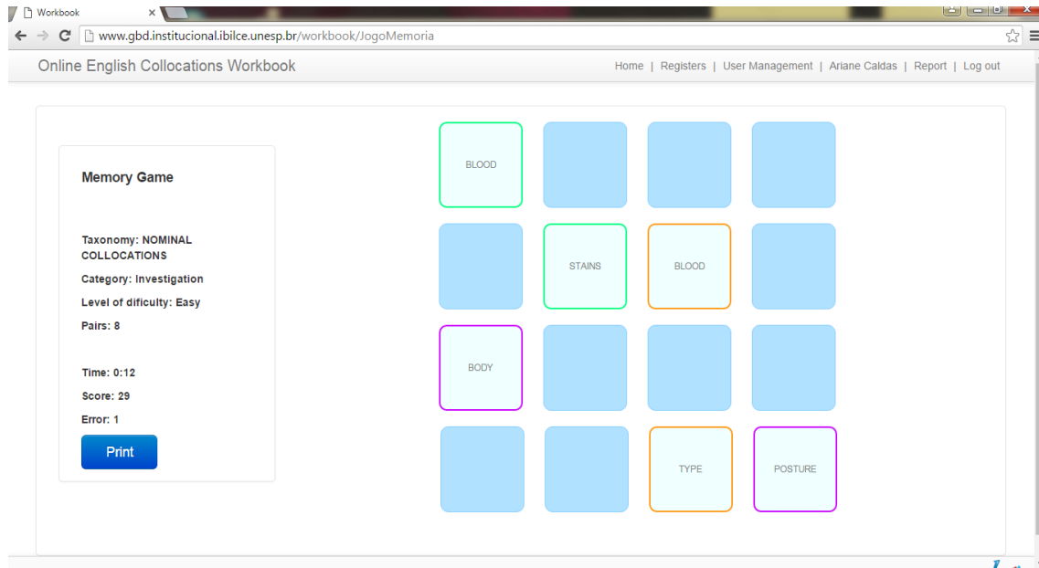
Figura1: Tela do Memory Game no Online English Collocations Workbook.