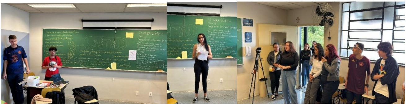
Figura 03 – Apresentações dos licenciandos da UNITAU na PUCSP

Concernente às propostas de novembro, edição de fechamento do ano letivo, o evento organizou-se como experiências formativas que articularam brincadeira, performance e reflexão crítica para desvelar problemas sociais urgentes e seus impactos na vida coletiva. Desde a abertura, as dinâmicas de interação mobilizaram temas como violência urbana (massacres), crises ambientais (poluição, desmatamento e enchentes), negligência governamental e riscos à saúde pública (contaminação por substâncias tóxicas), de forma a situar os participantes em cenários concretos de injustiça social. As apresentações performáticas e atividades colaborativas aprofundaram essas questões ao promover a reconstrução coletiva de narrativas e a vivência de experiências marcadas por desigualdade, exclusão e vulnerabilidade. Nas visitas aos stands de cada escola participante, separadas em diferentes salas, como a Figura 3 destaca abaixo a sala da UNITAU, os grupos entraram em contato com ações locais e produções que expressam resistência, como plantio de árvores, escriturinhas e intervenções artísticas, de forma a iluminar respostas comunitárias frente aos problemas enfrentados. Tais práticas dialogam diretamente com a LAC ao promover pedagogias performativas e críticas que articulam linguagem, corpo e ação social como formas de intervenção no mundo.