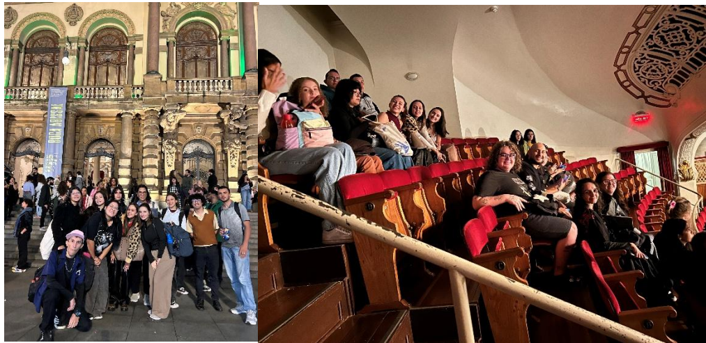
Figura 04 – Participação de um espetáculo de dança no Teatro Municipal de SP

No âmbito das experiências formativas culturais, a considerar a importância de ampliação do repertório estético e crítico dos futuros docentes, as atividades foram organizadas de modo a promover o contato direto com diferentes linguagens artísticas e espaços culturais de relevância. Em maio, como a Figura 3 abaixo demonstra, os licenciandos estiveram no Teatro Municipal de São Paulo, onde assistiram a um espetáculo de dança que possibilitou a vivência da linguagem corporal como forma de expressão estética, sensibilização e produção de significações, o que oportunizou reflexões sobre arte, emoção e formação humana (ESTEFOGO, 2025).