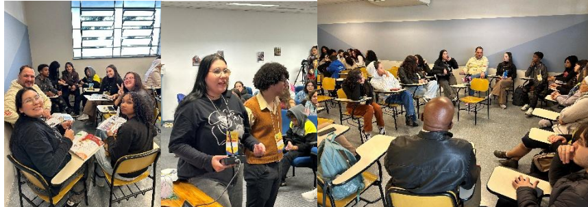
Figura 01 – Rodas de conversa, seminários, apresentações