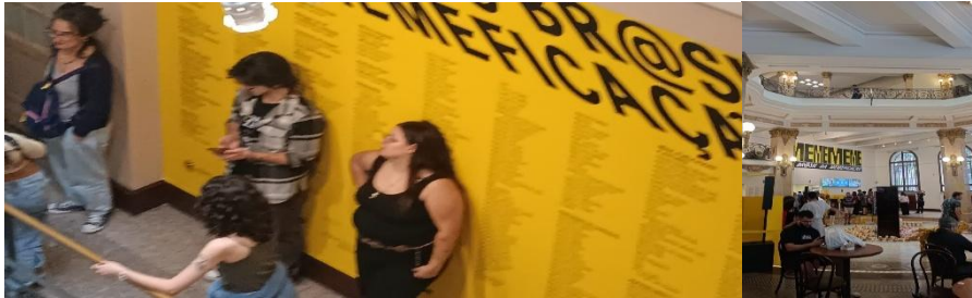
Figura 05 – Visita ao Centro Cultural Banco do Brasil