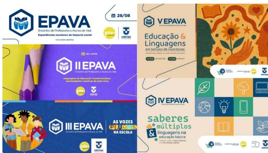
Figura 02 – Identidades Visuais dos Encontros de Professores e Alunos do Vale do Paraíba (2021-2025)

A concepção das identidades visuais do EPAVA partiu do princípio de que o evento deveria refletir, também visualmente, seu caráter dialógico, inclusivo e plural. Diferentemente do SePla, cuja identidade dialoga mais diretamente com a pesquisa acadêmica stricto sensu , o EPAVA exigia uma linguagem visual capaz de acolher diferentes públicos (professores da educação básica, estudantes de graduação, pós-graduandos e pesquisadores). Assim, os projetos gráficos buscaram evidenciar ideias de encontro, troca, colaboração e entrelaçamento de saberes, por meio de escolhas cromáticas, símbolos e composições que estimulassem pertencimento e proximidade.