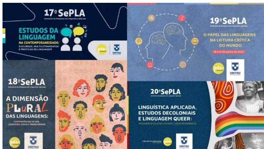
Figura 01 – Identidades Visuais dos Seminários de Pesquisas em Linguística Aplicada (2021-2024)