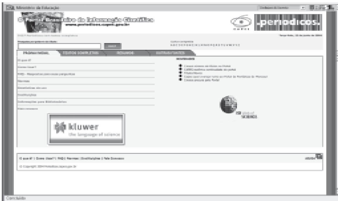
Figura 1 – Tela de abertura do Portal de Periódicos da CAPES

A Figura (1) ilustra a página de abertura do Portal de Periódicos da CAPES.