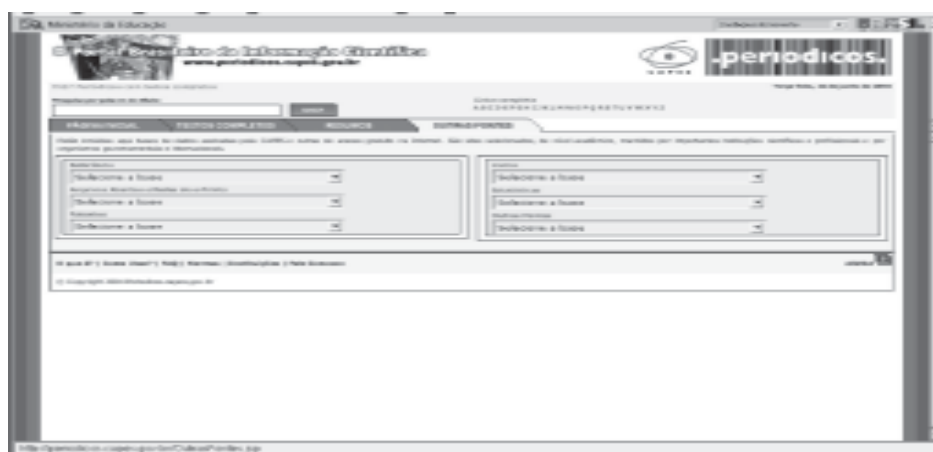
Figura 4 – Tela para busca em outras fontes de pesquisa

As consultas às fontes por Ordem Alfabética e por Palavra do Título , são análogas às mesmas modalidades para textos completos e para resumos, a menos do fato de que consultam a base de dados referente às outras fontes de pesquisa.