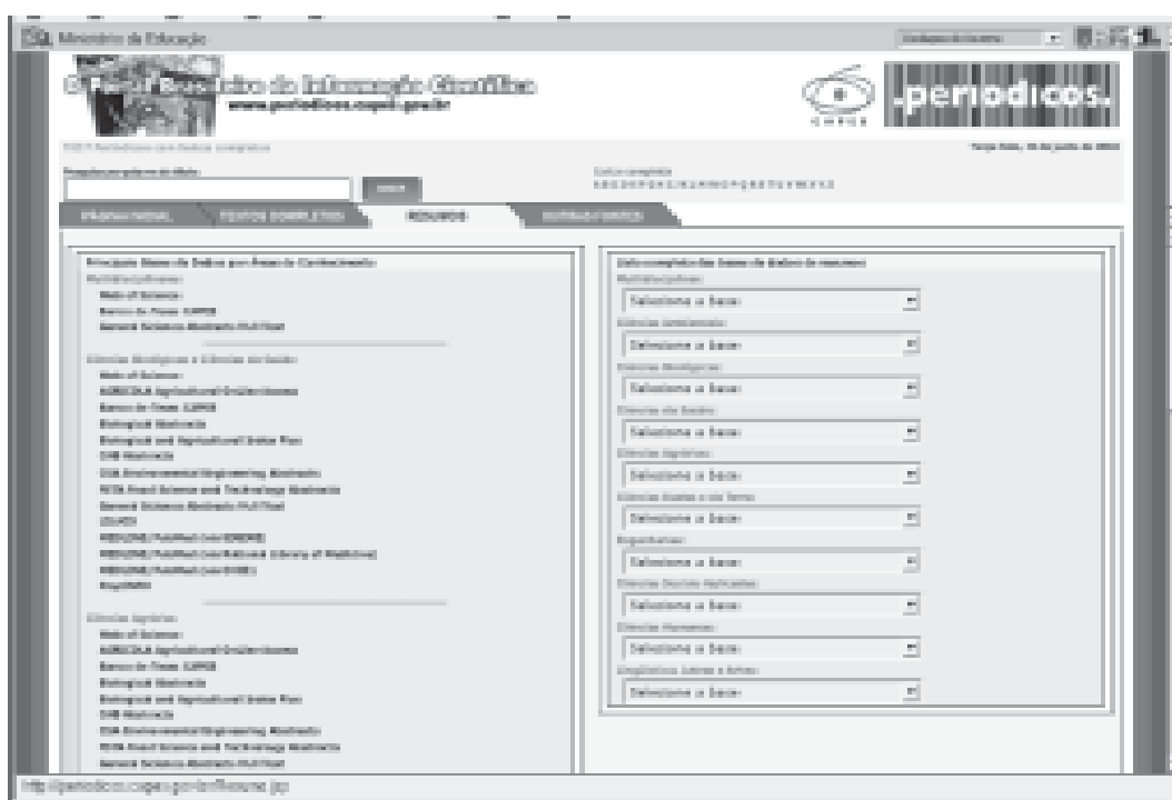
Figura 2 – Tela para busca por textos completos

Dentro das modalidades de busca por textos completos, tendo-se em mãos o título da publicação que se deseja consultar, pode-se acessá-la diretamente pela Lista Alfabética contida na tela ilustrada na Fig. (2).