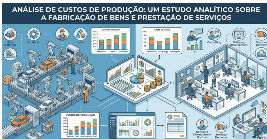
Figura 1 | Centralização dos custos operacionais e controles gerenciais

Nesse sentido, as abordagens tecnológicas (Benevides 1 et al. , 2024) contribuem para o controle financeiro e aprimoramento da eficiência operacional, especialmente quando associadas a sistemas integrados como o ERP que centraliza informações conforme ilustra Figura 1.