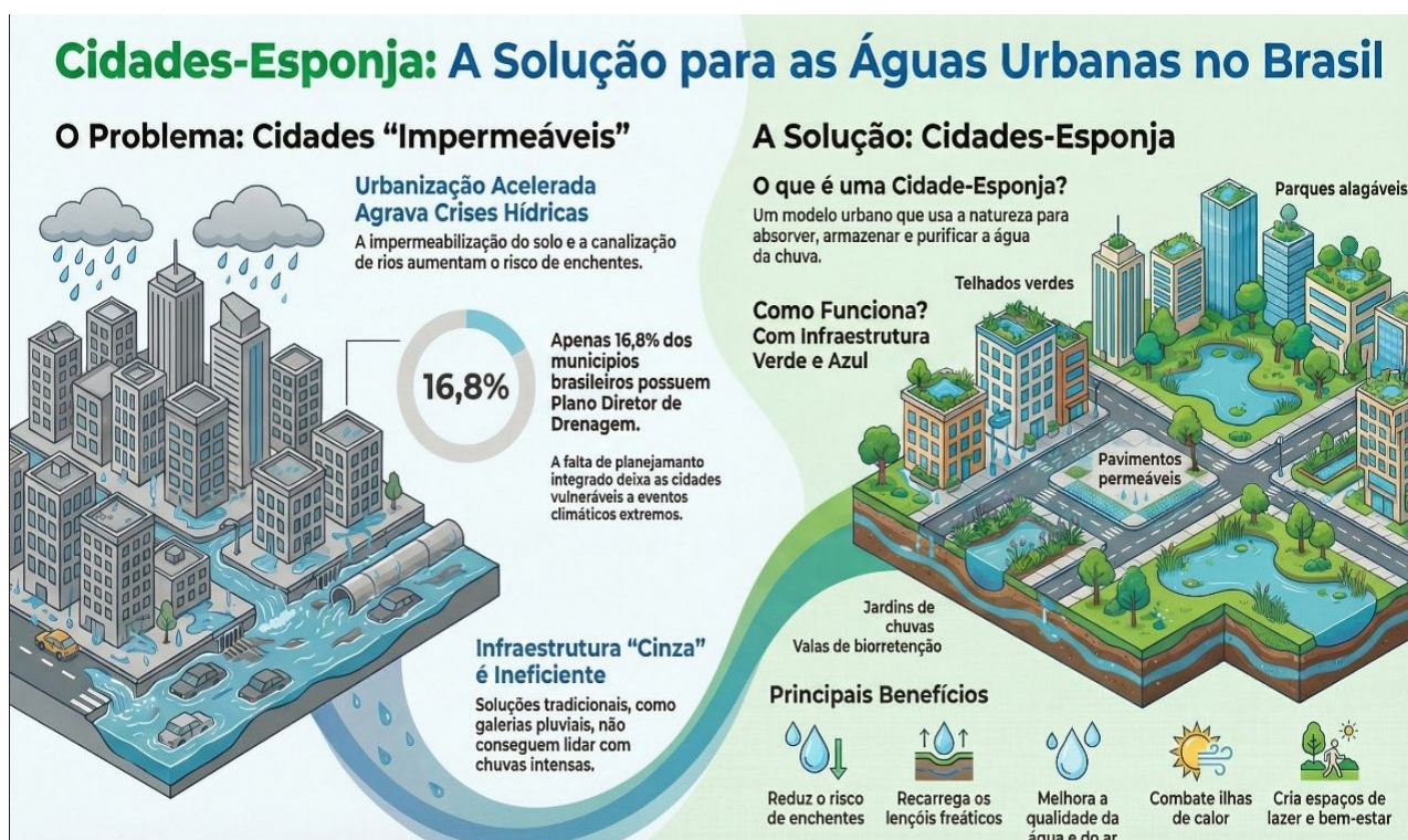
Figura 2 | Cidade-Esponja fundamenta-se na ecologia urbana

Diferentemente da drenagem convencional, que prioriza a rápida condução das águas pluviais, esse paradigma busca reter, infiltrar e reutilizar a água dentro da própria bacia hidrográfica conforme ilustra a Figura 2 (Zanon et al. , 2025; Zevenbergen; Fu; Pathirana, 2018).