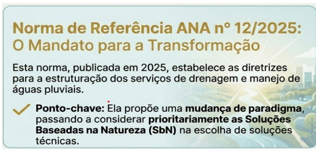
Figura 3 | Cidade-Esponja e a Norma de Referência nº 12/2025