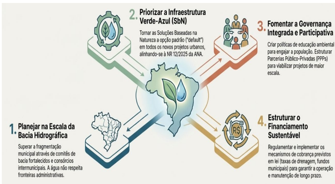
Figura 4 | Da cidade cinza para cidade esponja