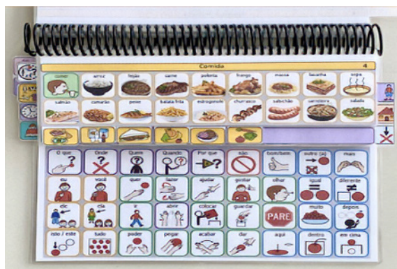
Figura 1 | Recurso de Baixa Tecnologia

Fonte: ARASAAC ( https://arasaac.org ). Licença: CC (BY-NC-SA).